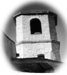
JONQUIERES St Mappalice