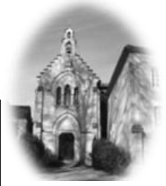
CAUSANS St Martin

Feuille n°9 – Année B 3 ème Dimanche de Carême Dimanche 3 Mars 2024